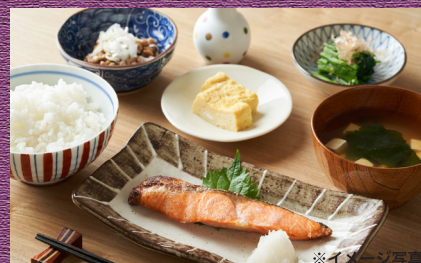
※イメージ写真 料理は味はもちろん、食欲をそそる見た目も重要