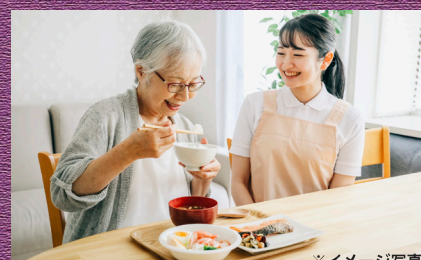
※イメージ写真 食事制限が必要な方などへの特別食にも柔軟に対応