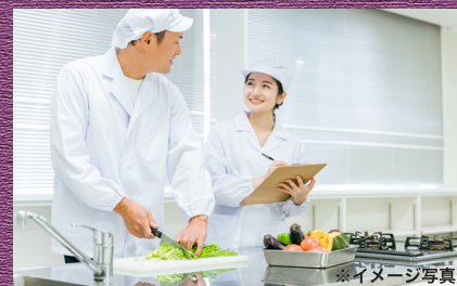
※イメージ写真 管理栄養士による計画的な献立で日々健康な生活を

食事は健康を維持し、病気の予防や治療に必要な栄養を摂取する大切な役割があります。ただそれだけのため料理では、あまりにも味気ないもの。素材や味にこだわった、あたたかくておいしい料理は、さっと心を豊かにし、満足感を与えることができます。う。ひな祭りや七夕、十五夜など、季節行事に関連した、日本の伝統的な食文化も大切にしています。